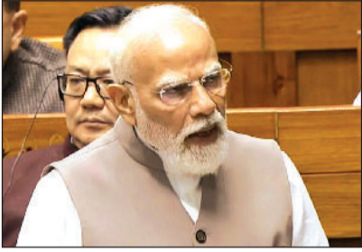
हरिभूमि ब्यूरो नई दिल्ली

अमेरिका-इजरायल और ईरान के मध्य जारी युद्ध के बीच प्रधानमंत्री नरेंद्र मोदी ने सोमवार को लोकसभा में पश्चिम-एशिया के हालात पर एक विस्तृत बयान दिया। जिसमें उन्होंने मौजूदा चिंताजनक परिस्थिति के बीच कई महत्वपूर्ण तथ्य देश की आम-जनता के सामने रखे। दोपहर 2 बजे से सदन में शुरू हुए अपने लगभग 24 मिनट के भाषण में पीएम ने स्पष्ट किया कि बीते 3 हफ्तों से चल रही इस लड़ाई ने भारत के लिए भी आर्थिक से लेकर राष्ट्रीय सुरक्षा स्तर पर अप्रत्याशित चुनौतियां खड़ी कर दी हैं। वहीं, इसका पूरी दुनिया पर लंबे वक्त तक प्रभाव पड़ने की आशंका है। इसलिए हमें कोरोना महामारी की तरह ही इस बार भी पूरी एकजुटता से तैयार रहने की आवश्यकता है। फिलहाल लोगों के लिए घबराने वाली कोई बात नहीं है। क्योंकि केंद्र के पास कच्चे-तेल से लेकर डीजल और प्राकृतिक गैस (एलपीजी) तक का पर्याप्त भंडार मौजूद है। सरकार चुनौती से निपटने के लिए छोटी, मध्यम और दीर्घकालिक रणनीति पर कर रही है। इसके अलावा सतर्क और संवेदनशील रुख अपनाने हुए हर जरूरी कदम उठा रही है। शेष पेज 5 पर