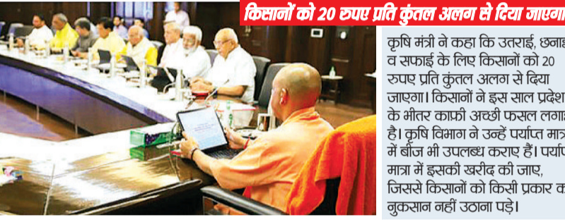
किसानों को 20 रुपए प्रति कुंतल अलग से दिया जाएगा

सीएम योगी आदित्यनाथ की अध्यक्षता में सोमवार को लोकभवन में कैबिनेट की बैठक हुई। इसमें कुल 37 प्रस्ताव आए, जिसमें से कैबिनेट ने 35 को स्वीकृति प्रदान की। इसमें गेहूं खरीद पर भी निर्णय किया गया। कैबिनेट बैठक के बाद कृषि मंत्री सूर्य प्रताप शाही ने पत्रकारों को इस संदर्भ में विस्तृत जानकारी दी। कृषि मंत्री ने बताया कि रबी विपणन वर्ष 2026-27 के लिए गेहूं का न्यूनतम समर्थन मूल्य (एमएसपी) 2585 रुपए प्रति कुंतल तय किया गया है। केंद्र सरकार ने गत वर्ष की तुलना में 160 रुपए प्रति कुंतल की वृद्धि की है। रामनवमी के उपरांत 30 मार्च से गेहूं खरीद होगी, जो 15 जून तक चलेगी। कृषि मंत्री ने बताया कि प्रदेश में खाद्य विभाग की विपणन शाखा सहित कुल 8 एजेंसियों द्वारा 6500 क्रय केंद्र स्थापित होंगे। क्रय केंद्र सुबह 9 से शाम 6 बजे तक खुले रहेंगे।