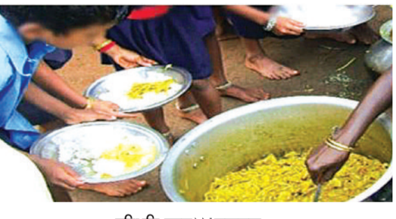
हरिभूमि न्यूज ►► लखनऊ

उत्तर प्रदेश के बाल विकास सेवा एवं पुष्पहार विभाग में पोषण आहार आपूर्ति को लेकर गंभीर अनियमितताओं और भ्रष्टाचार के आरोप सामने आए हैं। इसमें विभाग के अलावा भारत सरकार की विभाग द्वारा नामित केंद्रीय एजेंसी नेफेड पर आरोप है कि उसने आपूर्तिकर्ताओं के चयन में पारदर्शिता और प्रतिस्पर्धा के नियमों की अनदेखी की है। हालांकि अधिकारी इस आरोप को पूरी तौर से ठुकरा रहे हैं और दावा कर रहे हैं कि सभी औपचारिकताओं के अनुरूप चयन किया जा रहा है पुष्पहार की पूरी गुणवत्ता का ख्याल रखा जा रहा है।