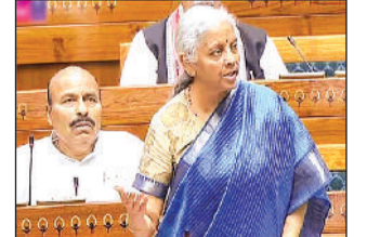
हरिभूमि ब्यूरो नई दिल्ली

संसदीय समिति (जेपीसी) को भेज दिया गया। जिसकी मुख्य वजह विपक्ष का विरोध था। लेकिन यहां एक चौंकाने वाला तथ्य ये भी है कि विधेयक को जेपीसी के पास भेजने की मांग विपक्ष की जेपीसी से नहीं की गई थी। बल्कि वित्त मंत्री निर्मला सीतारमण ने इस बाबत सदन में