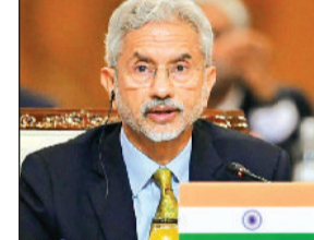
हरिभूमि ब्यूरो नई दिल्ली