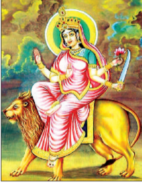
चंद्रहासोत्सवकालकरा शारदूलवरवाहन। कात्यायनी शुभ श्राद्धदेवी दमनवाञ्छिनी।